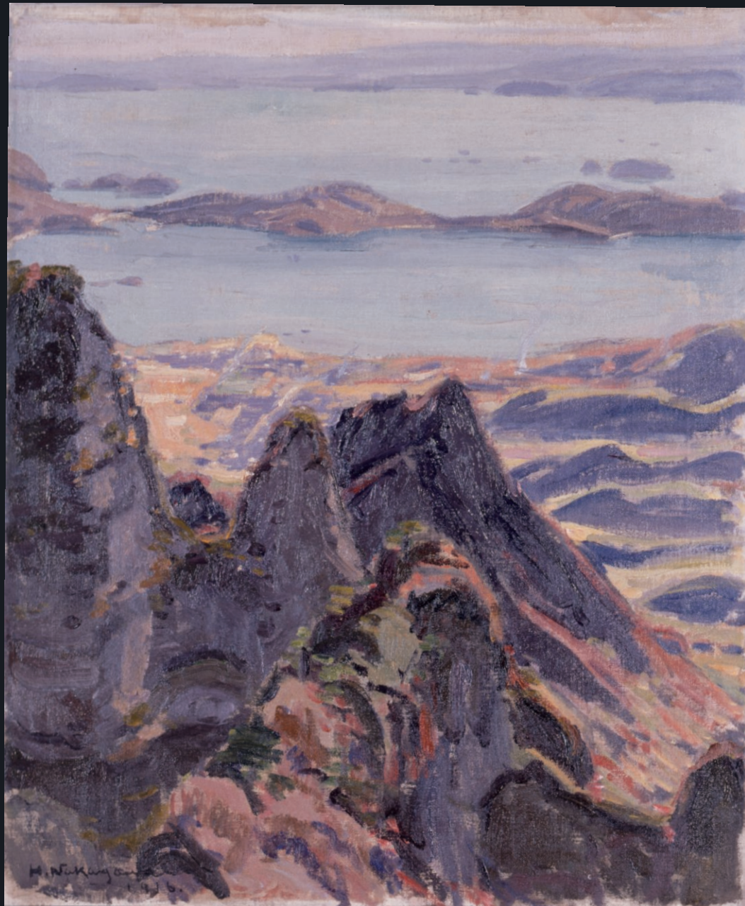
《寒霞渓四望眺より》1916年