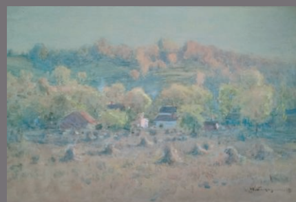
中川八郎 《田舎の秋》1904年