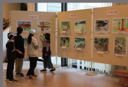
展示イメージ (五十崎文化祭)